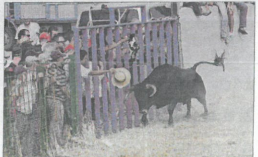
Un novillo acude a la cita de un espectador.