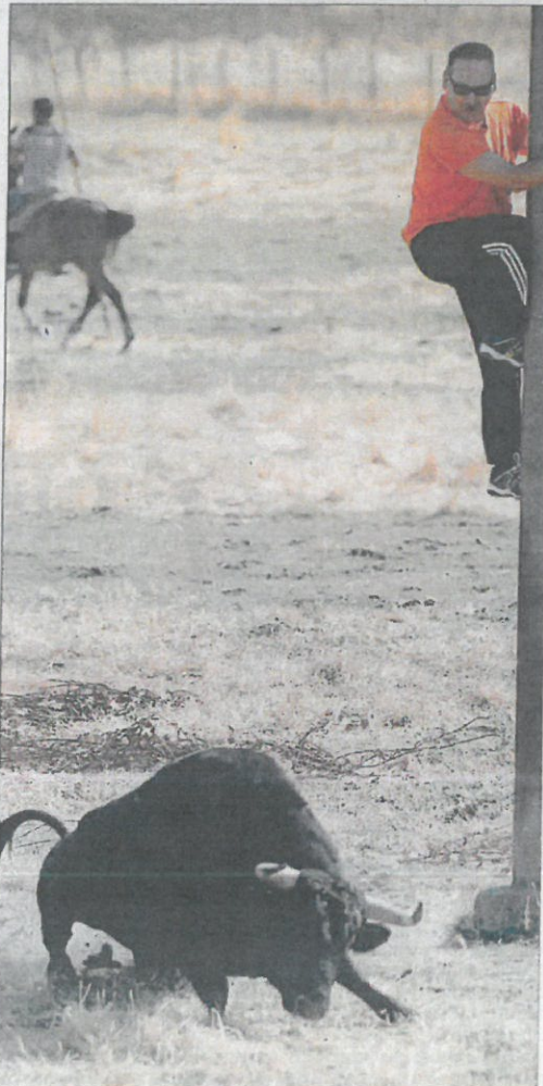
Un aficionado se protege del toro que intenta embestirle.