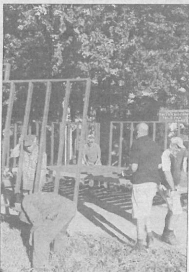
Instalación de las merinas para los encierros.