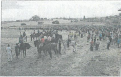
Caballistas y espectadores en la pradera.