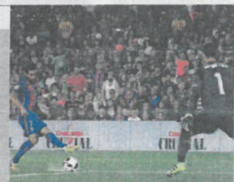
Arda Turan marca uno de los goles.

El combinado que lidera Gasol realiza su mejor partido y luchará por conseguir su cuarta preseña en unos Juegos