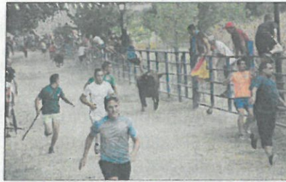
Un grupo de jóvenes corre ante los toros.