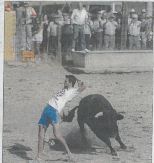
Un recortador se atreve con uno de los toros.