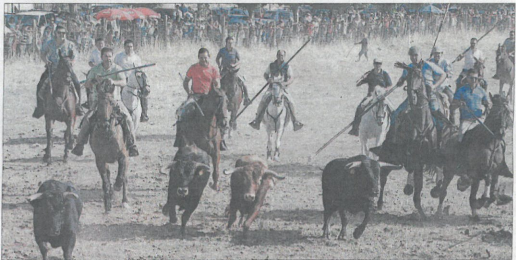
Los caballistas conducen la manada de astados por la pradera de Venialbo.

Los festejos de Venialbo siguen hoy su curso con una exhibición de aves rapaces por Halconeros de Castilla y León y el Festival de cine al aire libre.