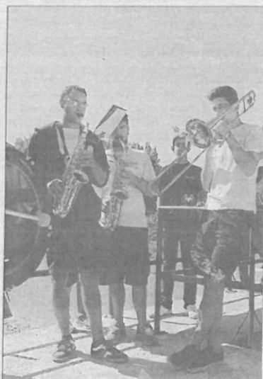
Una charanga anima las fiestas.

días los vecinos de Venialbo a los que se acercan a las fiestas de la localidad y el buen ambiente de los encierros, con las bodegas situadas frente a la pradera en la que se desarrolla el encierro a caballo al que le sigue el que se celebra por las calles del pueblo.