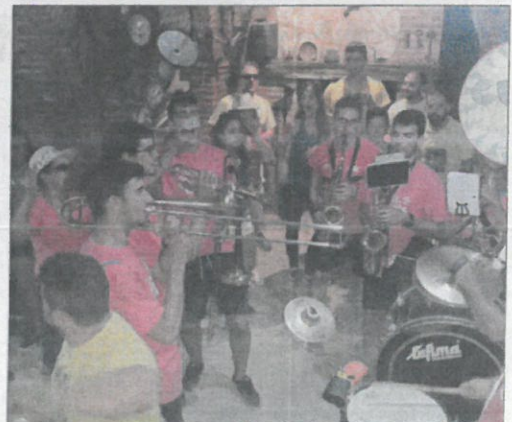
Música de charanga en una bodega tras el encierro.