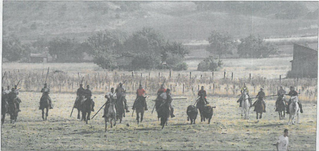
Los caballistas dirigen a los dos astados de Miranda de Pericalvo que protagonizaron el encierro de ayer.

Hoy Venialbo recibirá a la Asociación de Campaneros Zamoranos, que a partir de las 11.30 ofrecerá una exhibición de repique para anunciar la misa en honor a la Virgen de la Asunción, que comenzará a las 12.30 horas. Después, el Ayuntamiento convida a todos a un vermut en el salón de usos múltiples. Por la tarde los niños podrán pasear en burro (17h), y los adultos disfrutar de un partido de pelota. A la media noche toro de cajón y macrodiscoteca Escarlata. Mañana martes habrá de nuevo repiques y misa en honor a San Roque, a la misma hora, y en horario vespertino, a partir de las 19.30 horas, un toro de cajón y cuatro vacas. La verbena, a cargo de la orquesta Flamingo.