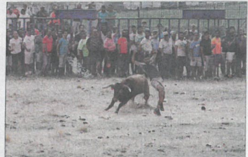
Un recortador esquivo los cuernos del astado.