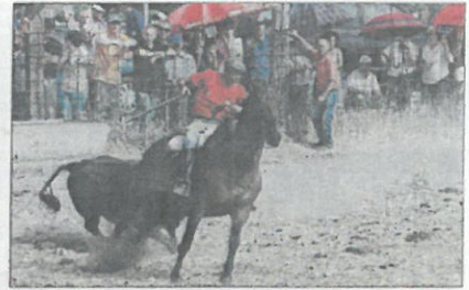
Un caballista escapa de la acometida del toro.