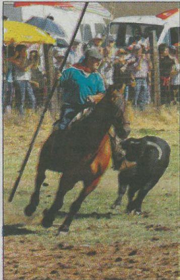
Un toro persigue al caballo.

Los vecinos de Venialbo quedan emplazados hasta la próxima fiesta, que será la de la vendimia el 12 de octubre.