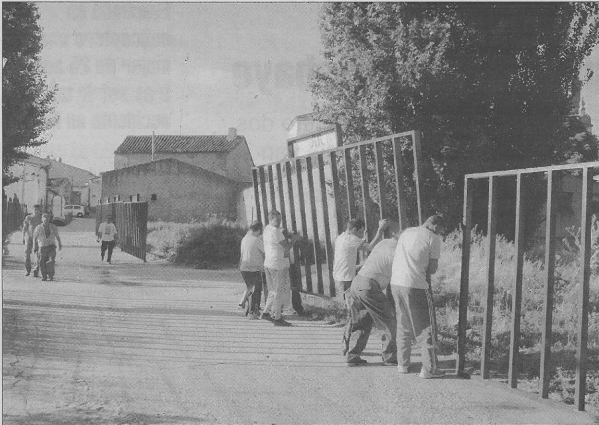
Un grupo de vecinos de Venialbo fija las talanqueras que acotan el recorrido del encierro.