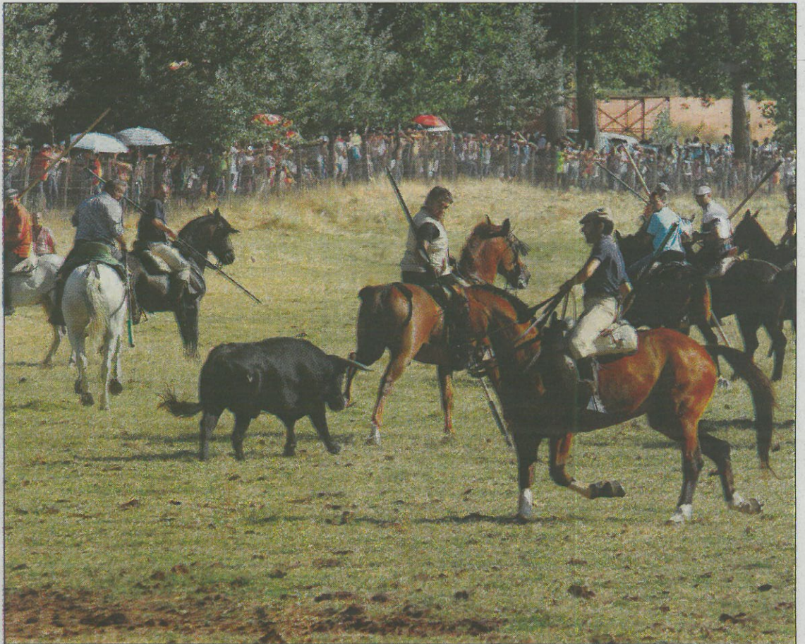
Varios caballistas junto a uno de los novillos que ayer se soltaron en la pradera de Venialbo.