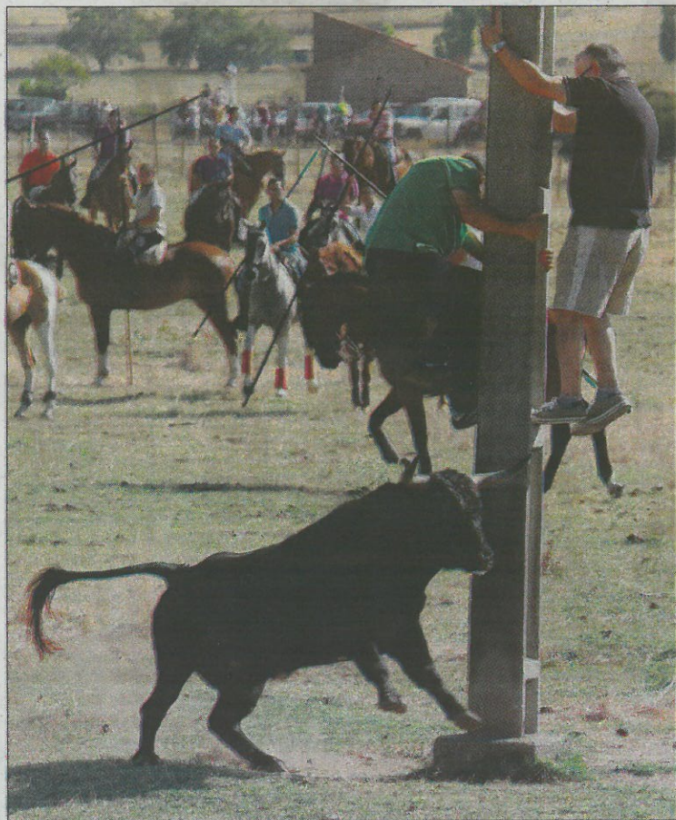
Dos aficionados se suben a un poste para protegerse del novillo; a la derecha, arrancadas de los astados con cortes incluidos.