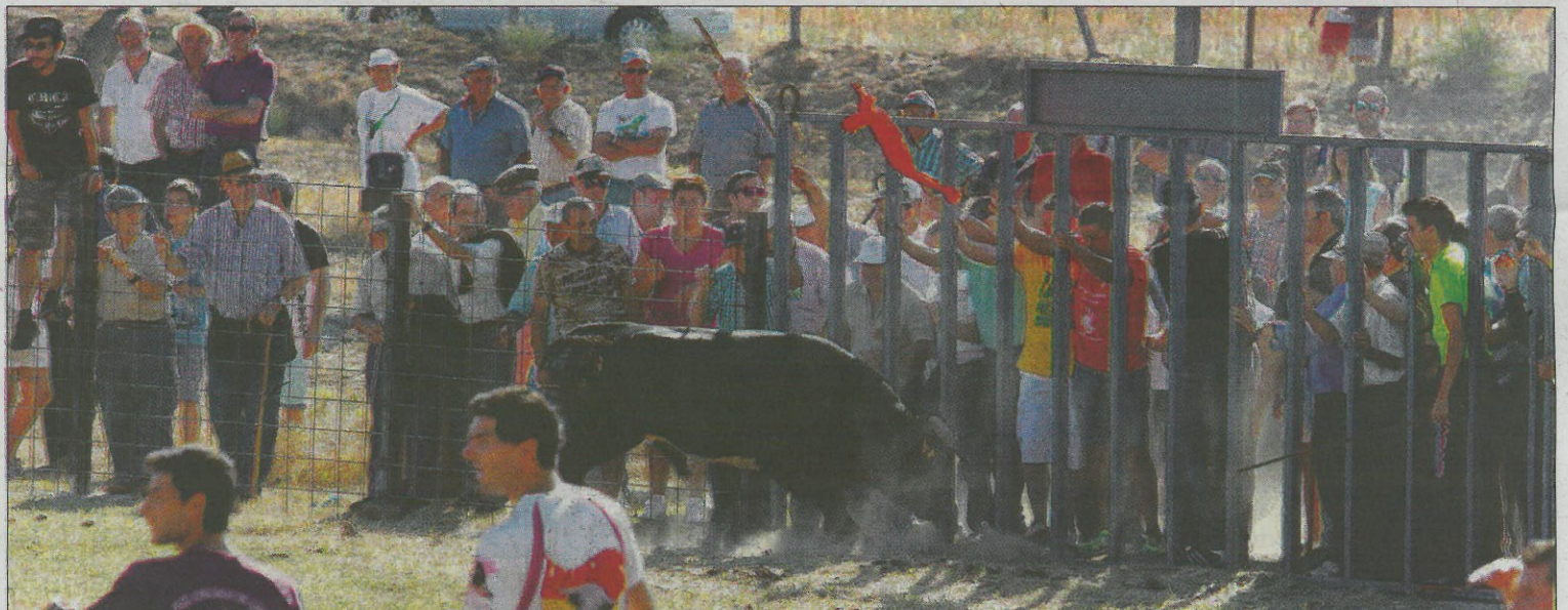
Los espectadores se protegen de la arremetida del toro tras las talanqueras.